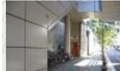
自転車置き場 死角あり