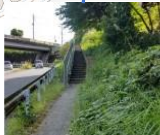
狭くて長い階段が続く 道幅は一人一人分 街灯なし 夏は草木が生い茂る