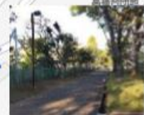
夕方には人通りが少ない