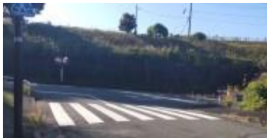
草で車が見えづらい 横断注意