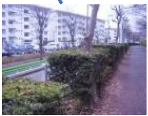
百草台自然公園前の歩道、 車道より高く視認性が悪い