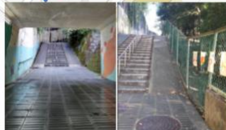
中程久保トンネル～階段 苔が生えたと階段が滑りやすい