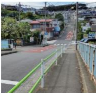
中程久保の急な坂道 横断歩道 飛び出し注意