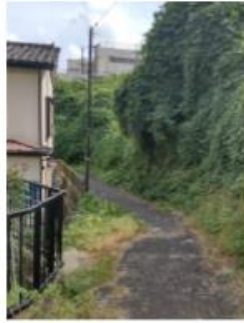
草木が茂って薄暗い細い道