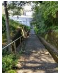
街灯が少なく暗い