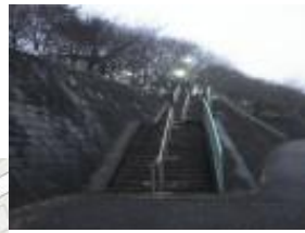
団地に続く階段 段数の多い階段が続く 人通りは少ない