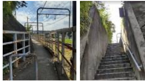
線路沿いの階段とその上の道 過去に不審者情報有り