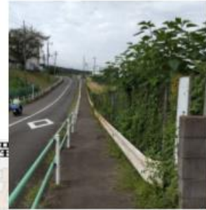
夏は草木が生い茂るフェンスが傾いている