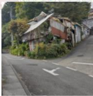
-道幅が狭い -歩道の白線無し -バイク・車のスピード注意