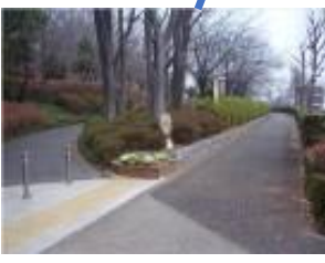
百草台自然公園入口 不審者情報有り