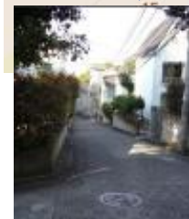
昼間も人通りの無い ドーム多摩付近