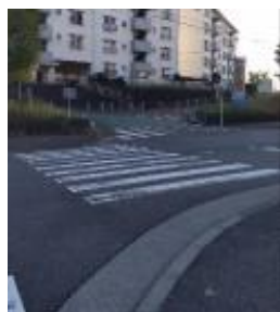
団地からの車の出 入り注意