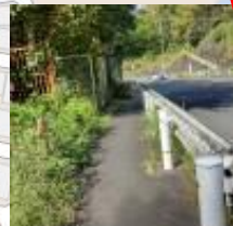
道幅は一人一人分 夏は草木が生い茂る