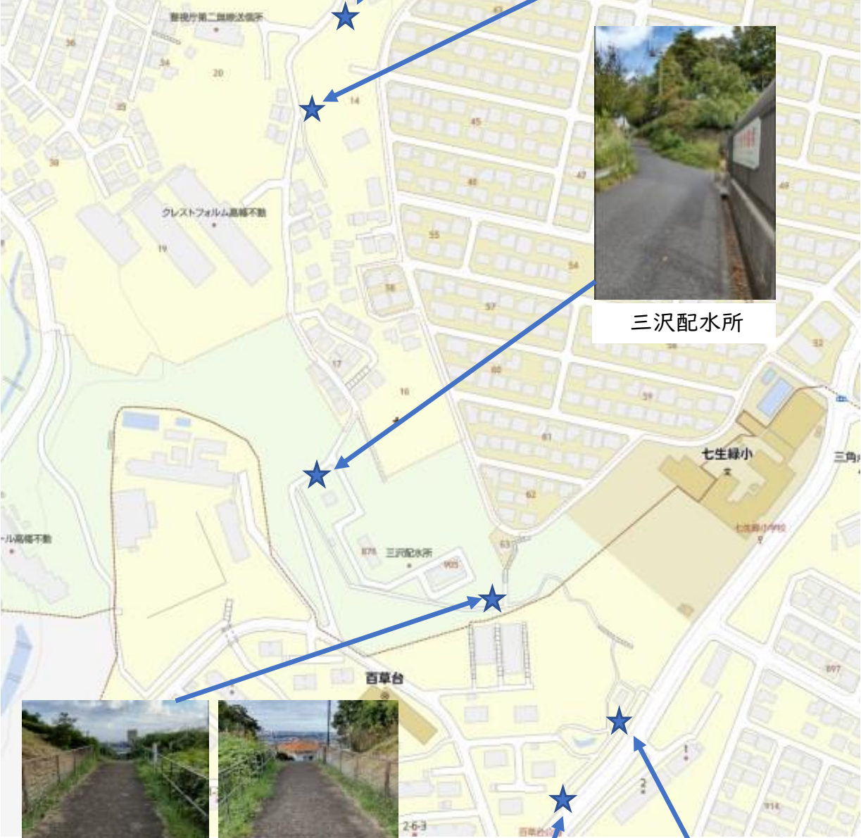
三沢配水所～川崎街道途中