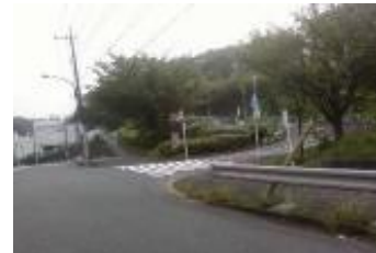
冬以外は葉っぱが生い茂 る