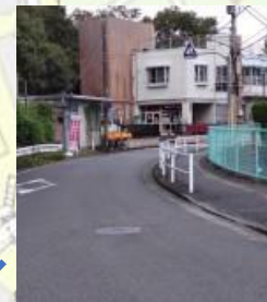
児童館出入口 飛び出し注意