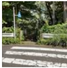
団地9号棟の裏側の階段