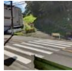
階段に続く坂道と横断歩道