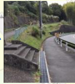
人通りが少ない カーブが続く道