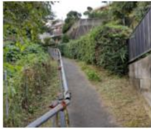
日野市消防団第七分団第三部の裏の道 夏は草木が生い茂った細い道 街灯なし